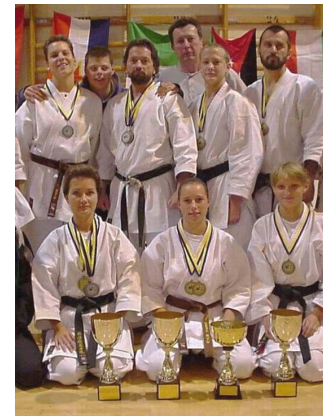
Skoro už pro pamětníky... Scandinavian CUP 2000

tečnou protislužbu ve smyslu práce, ať již ve škole, nebo třeba ve sportu. Nejen naši seniorští špičkoví závodníci, ale i masters již nepotřebují medaile, diplomy a poháry, kterých mají plné skříň. Je to vděk svému senseiovi a svému klubu (tedy aspoň tak to chápou) za to, když ještě byli v začátcích, že jim byla věnována stejná péče jako těm, kteří již byli na výsluní, za to že dostali šanci být lepšími a něco dokázat. Za moje trénování se přiblížil počet karatekú které jsem poznal magic kému číslu 2000. Je na místě můj vděk, že alespoň z těch dřívějších kteří si vzpomenout je pět-šest. Není to nostalgie. Je to výchovou a dobou. Já nikdy nezapomínám na svoje rodiče, trenéry či učitele. Nikdy nezapomínám že mi dali šanci jít cestou bojovníka. Nemělo by se zapomínat na ty, kteří nám dali život, kteří nám dali šanci žít lépe, nacházet nové věci a formovat svůj charakter. Měli bychom si zachovat k nim vždy úctu, respekt a vděk. Ale musíme je to nejdříve na učit. Tak že vám přeji do Nového roku ať již těm mladším nebo starším. Buďte vděčným všem, kteří mají o vás zájem, nezištně vás podporují a snaží se dávat něco ze sebe pro vaši cestu životem. Vnímejte co oni dělají pro vás a naučte se jim vracet ve formě respektu, úcty a loajality..