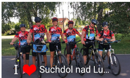
I ♥ Suchdol nad Lu...

Okurková sezóna může být pro tisk a média, rozhodně ne pro toho, kdo má rád pohyb, sport a přináší mu radost. Bez pravidelného sportování se necítí úplně ve své kůži. Měli jsme běžeckou výzvu o které bude psáno jinde, ale posílali jste mi různé chodecké výkony i v horských velikánech, aktivitu na kole a podobně. Pro většinu zdravě uvažující populace je to relax a cesta ke zdraví, pro, řekněme registrovaného sportovce, je to k tomu ještě nezbytnost a povinnost. Nikdy neříká nejde to, není čas, je to zkrátka droga v tom nejlepším slovy smyslu. Z druhé strany abychom sport začali